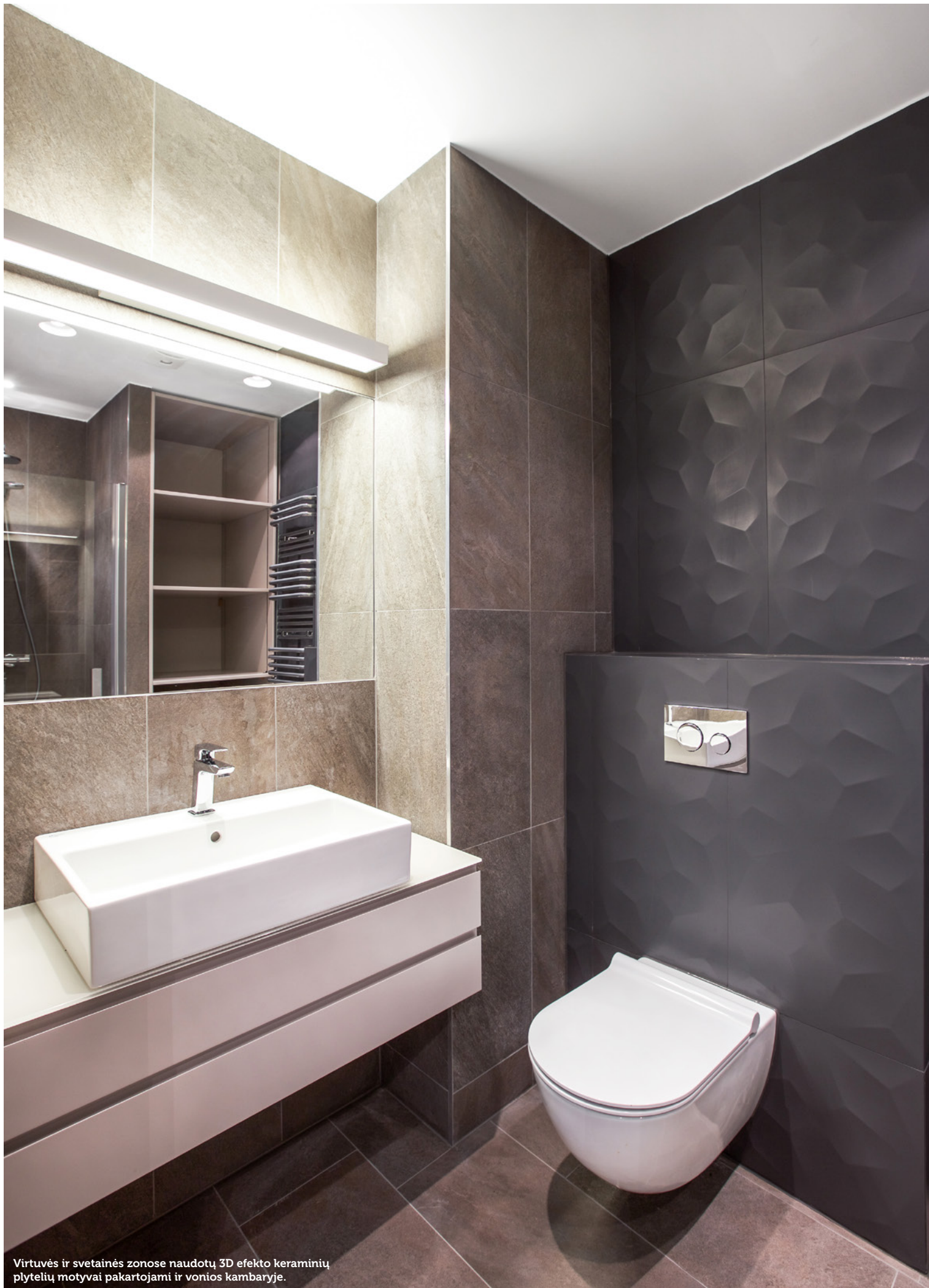
Virtuvės ir svetainės zonose naudotų 3D efekto keraminių plytelių motyvai pakartojami ir vonios kambaryje.