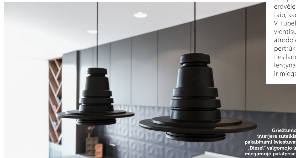
Griežtumo interjere suteikia pakabinami šviestuvai „Diesel“ valgomojo ir miegamojo patalpose.

Būtent valgomasis tapo pagrindiniu traukos centru, vyraujančia susibūrimo ir bendravimo vieta. Jo ir virtuvės zonos buvo taip pat šiek tiek pakoreguotos. Bendroje erdvėje esanti virtuvė suprojektuota taip, kad susilietų su svetaine, – šitaip, V. Tubelytės teigimu, pavyko sukurti vientisumo jausmą. Bendra erdvė vizualiai atrodo didesnė, palei ilgąją sieną be jokių pertrūkių išdėsčius virtuvės baldus, kurie ties langu užbaigiami originalia įstrižių linijų lentyna (toks pats lentynos tipas pritaikytas ir miegamojo erdvėje).