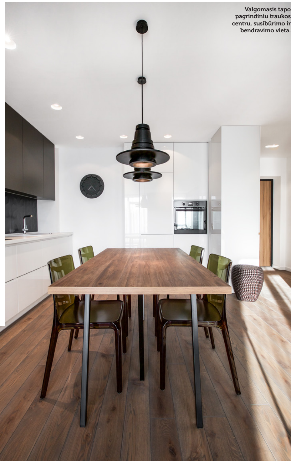
Valgomasis tapo pagrindiniu traukos centru, susibūrimo ir bendravimo vieta.