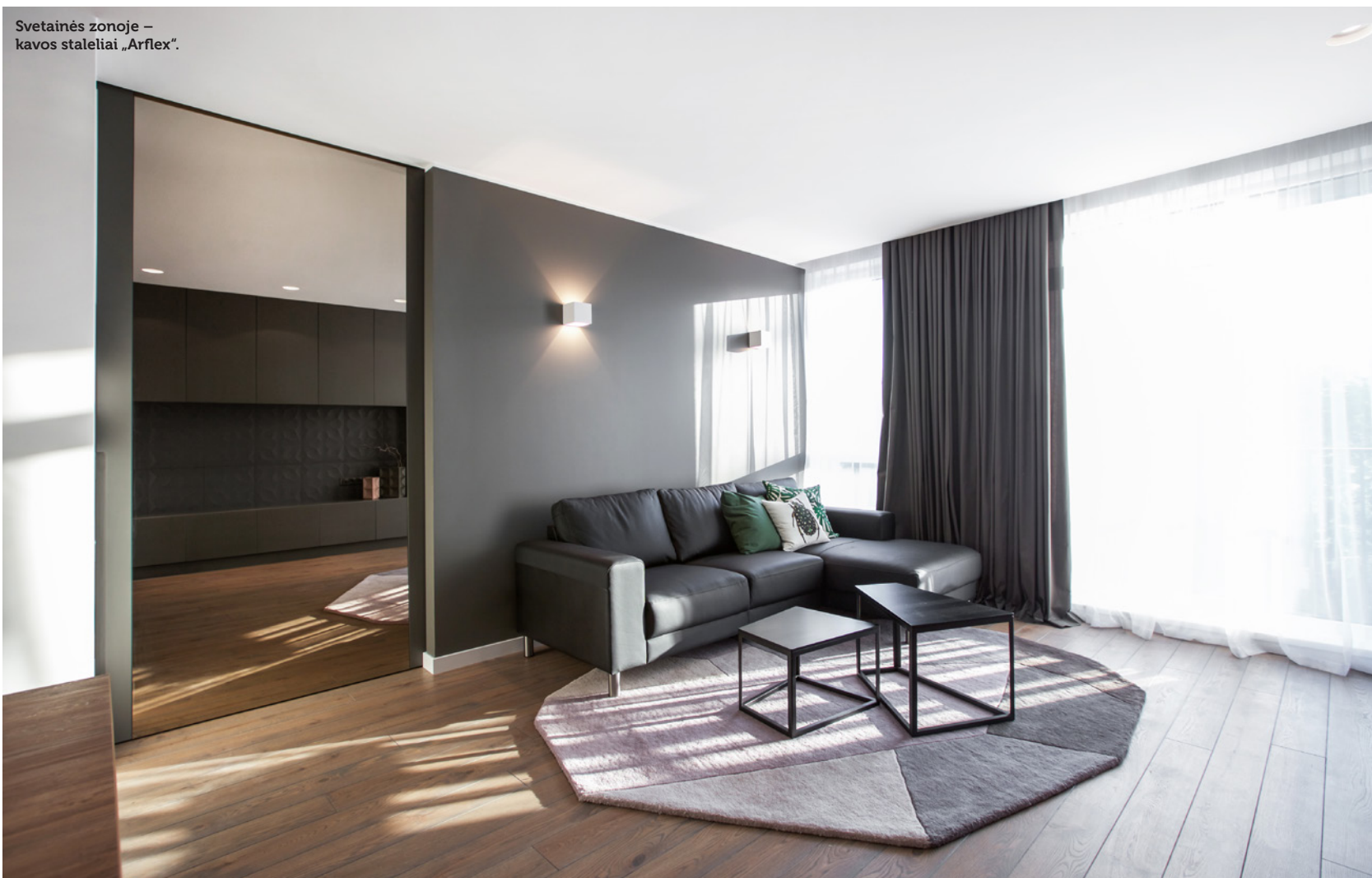
Svetainės zonoje – kavos staliukai „Arflex“.