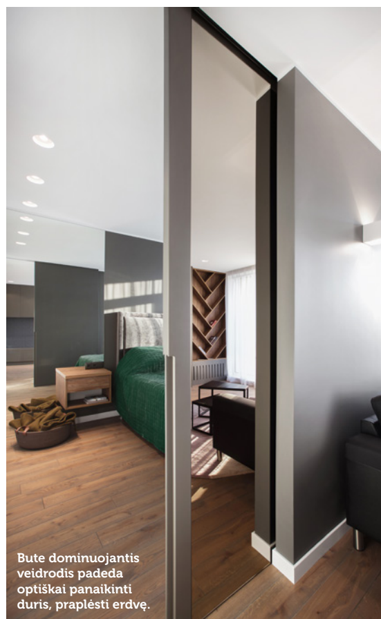
Bute dominuojantis veidrodis padeda optiškai panaikinti duris, praplėsti erdvę.