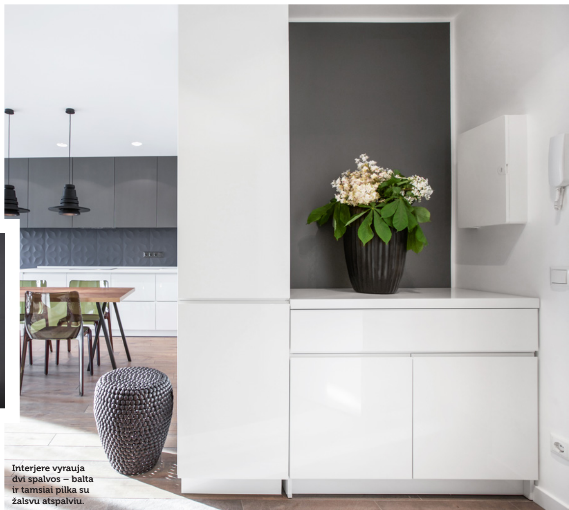
Interjere vyrauja dvi spalvos – balta ir tamsiai pilka su žalsvu atspalviu.

Neatsitiktinai bute nemažai medžio motyvų: medinės grindys, medžio dekoras padeda sušildyti nuosaikių, vėsokų atspalvių interjerą. Ir atvirkščiai, šiek tiek griežtumo suteikiama pakabinamais modernių formų šviestuvais valgomojo ir miegamojo patalpose. Savo funkciją – kurti jaukumą ir sušildyti interjerą atlieka ir spalviškai priderinta tekstilė: grakščiomis draperijomis krintančios užuolaidos, lovatiesė, kilimas.