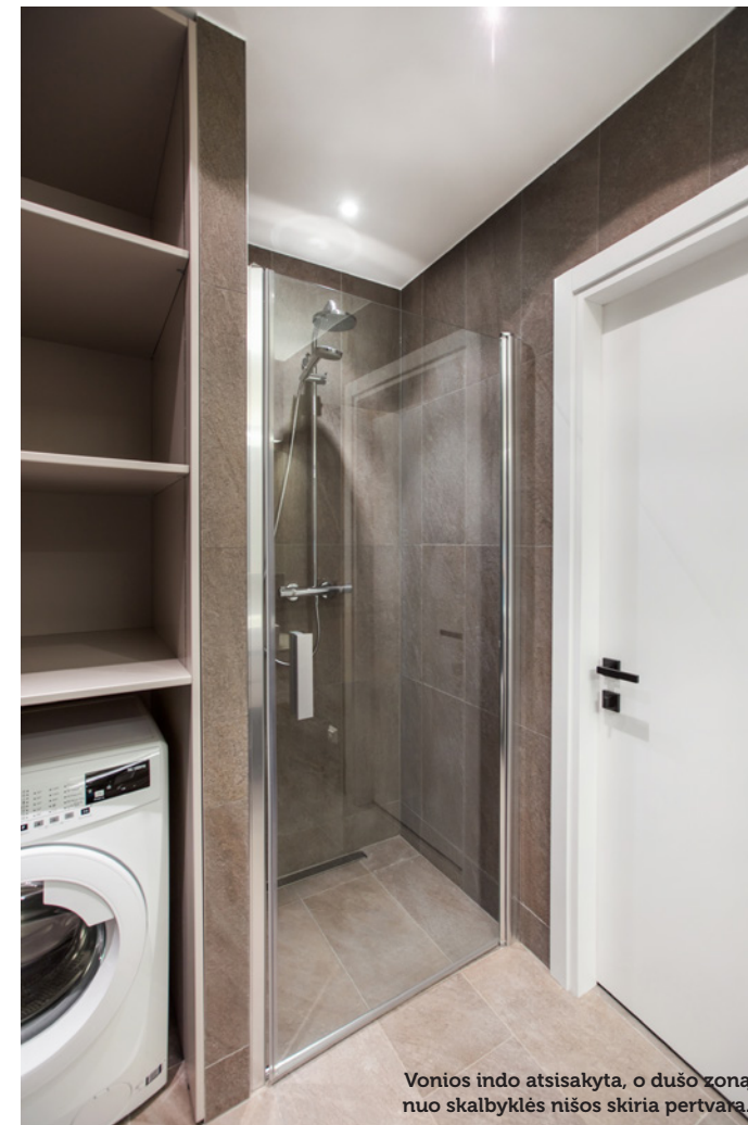
Vonios indo atsisakyta, o dušo zona nuo skalbyklės nišos skiria pertvara.