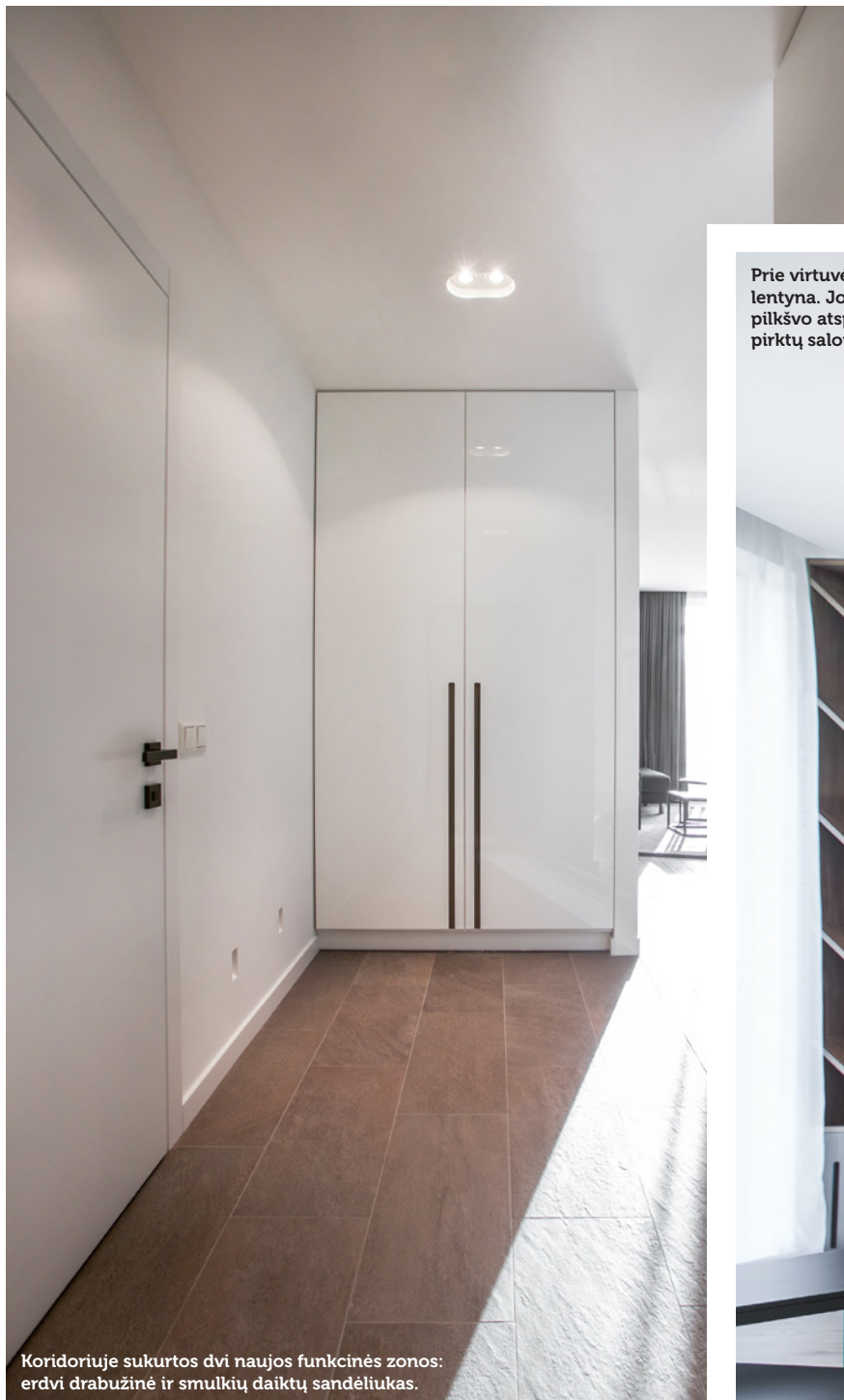
Koridoriuje sukurtos dvi naujos funkcinės zonos: erdvi drabužinė ir smulkių daiktų sandėliukas.

Prie virtuvės baldų šliejama originali įstrižų linijų lentyna. Jos tekstūra ir spalva buvo derinama prie pilkšvo atspalvio ąžuolinių grindinių lentų „Graphite“, pirktų salone „Medžio stilius“.