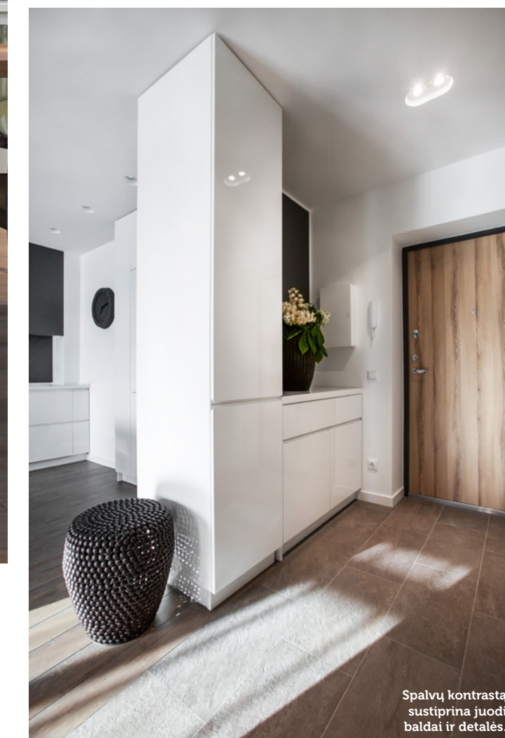
Spalvų kontrastą sustiprina juodi baldai ir detalės.